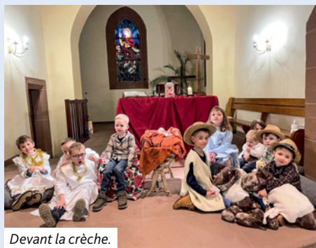
Devant la crèche.

Les fêtes de Noël dans le Vignoble ont été bien fréquentées quel que soit le lieu. Il faudrait beaucoup plus de pages pour que d'autres photos puissent être publiées mais l'essentiel c'est de garder le merveilleux message de ces moments de fête et de louange. Non pas garder pour soi mais pour témoigner et partager cette Bonne Nouvelle que Dieu s'est fait proche et semblable à nous. Nous sommes reconnaissants et nous rendons grâce pour tous ces moments.