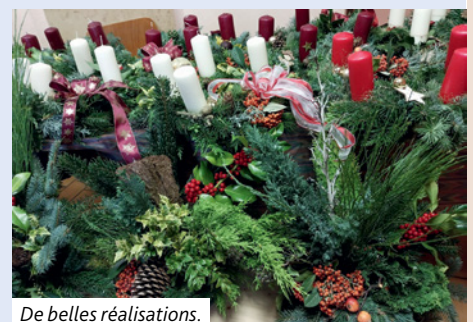
De belles réalisations.