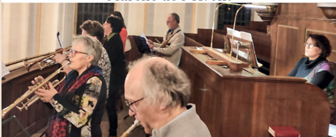
veillée de Noël en musique