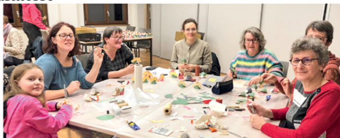
confection d'anges à offrir