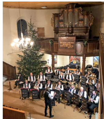
Concert de l'Harmonie de Hunspach, 30 novembre.

Ces images témoignent de la joie simple d'une communauté appelée à vivre et à partager l'espérance reçue.