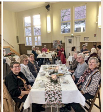
Après-midi des Colombages à Seebach, 9 décembre.