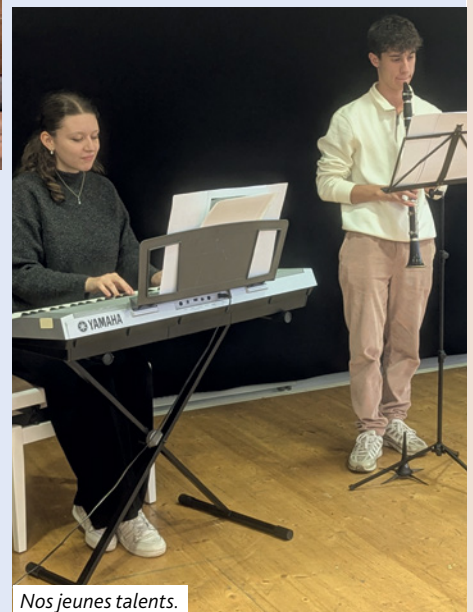
Nos jeunes talents.

postes n'ont pas chômé non plus sans oublier toutes celles et ceux qui ont répondu présents à nos différentes manifestations. Merci pour cette belle générosité et ces temps de partage et de bon vivre ensemble qui réchauffent le cœur.