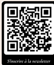
S'inscrire à la newsletter

L'intégralité des activités peut aussi se demander en format papier auprès de vos conseillers et pasteurs, mais aussi se trouver sur le site Internet, la page Facebook et Instagram!