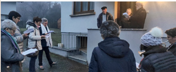
Marche de l' Avent