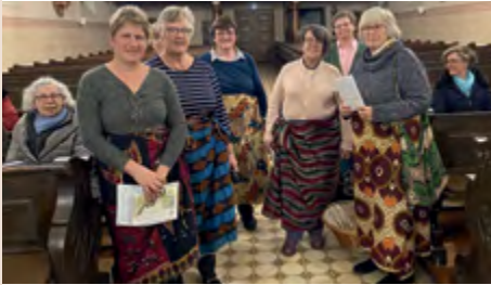
Femmes protestantes et catholiques en tenue africaine.