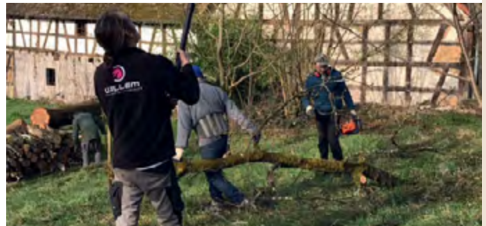
Quelques bénévoles en pleine action !

Samedi 9 mars, une petite troupe avec outils et engins adaptés, ont opéré la traditionnelle taille de printemps autour du presbytère. Motivation, beau temps et bonne humeur ont permis d'avancer rapidement dans les travaux et un apéro chaleureux a bouclé la matinée. Merci à tous !