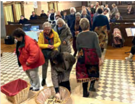
Procession vers l'autel en solidarité avec le Nigéria.

Cette année, les textes, les prières et les chants préparés par les femmes chrétiennes du Nigéria, sur le thème « Venez ! Je vous donnerai le repos », ont profondément marqué les cœurs dans l'église catholique de Seebach. Malgré les épreuves souvent très rudes de leur quotidien, les femmes nigérianes témoignent d'un courage et d'une constance remarquable dans la foi. Par leur message, elles nous invitent à porter avec elles une part de leurs fardeaux, en nous unissant à leur prière et en soutenant des projets de solidarité. Un grand merci aux femmes catholiques et protestantes du comité local, ainsi qu'à toute l'équipe de préparation.