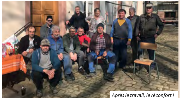
Après le travail, le réconfort !